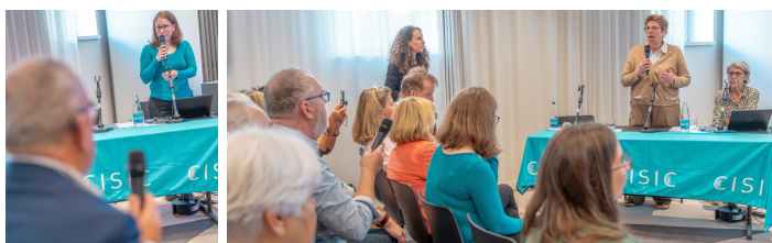
Des interventions des professionnels sur les réglages, la rééducation orthophonique ou encore la bi-implantation