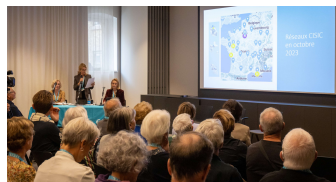
L'Assemblée Générale avec des bilans positifs