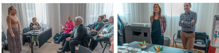
Des rencontres avec les 4 fabricants et notre partenaire assurance