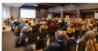
Une journée pleinement réussie avec 200 participants